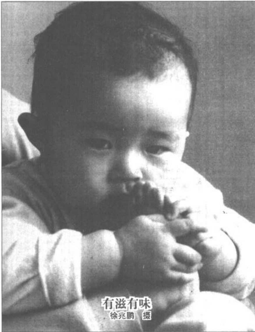
有滋有味

所以，我们要做一个“聪明”的消费者，不要接受商家“赐予”我们的不合理、不公平的规定，时刻警惕维护自身的合法权益。还有另一种情况，应提醒大家注意。《产品质量法》规定降价处理商品可以不退换。商“可以理解为经营者已经告知消费者此商品存在质量问题。所以消费者就不能再以“存在质量问题”而要求退换了。